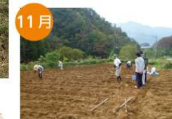
11月 大麦・小麦の播種 大麦・小麦は日当たりの良く水はけの良い畑が適しています。