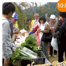
10月 収穫祭 農作物の収穫に感謝し、翌年の豊作を祈念する収穫祭。市の内外から毎年大勢の人々が参加しています。各種イベントや、収穫した新鮮な農作物の販売も行っています。