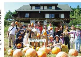
収穫祭と同時開催のハロウィン（パンプキンパッチ）