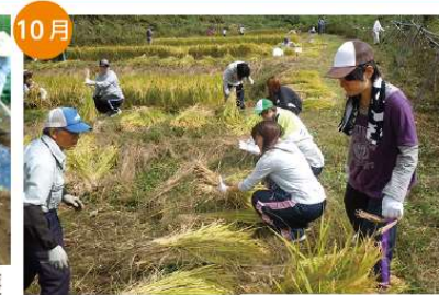
10月 稲刈り 大月短大生、都心在住者、地元の皆さんと一緒に楽しみながら稲刈りをしています。