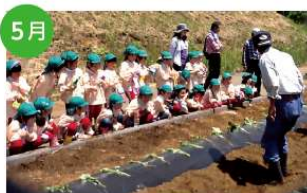
5月 さつまい植付体験 地元幼稚園児が苗を植え、順調に育つように水やりもしました。