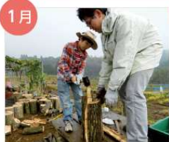
1月 間伐・新割り体験 計画的に間伐を行い、薪割りが体験できます。