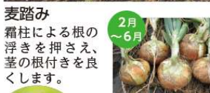
2月～6月 春野菜の収穫 前年に植え付けをした野菜を収穫。