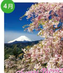
4月 桜まつり 満開（気候によって変わります）の3月～4月には桜祭りを開催。また千本桜プロジェクトとして、桜の記念植樹や交流会も行っています。（10月の収穫祭にも記念植樹を行います。）