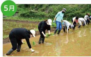
5月 田植え 幻のお米と言われる農林48号を自然栽培で育てています。