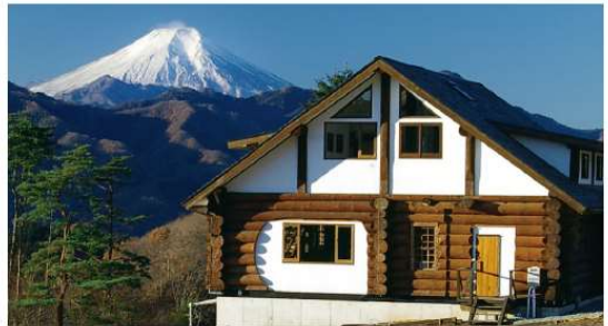
エコハウス (管理棟)