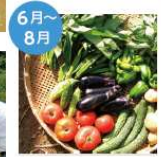
6月～8月 夏野菜の収穫 自分で作った野菜が一番美味いと皆さんが言います。