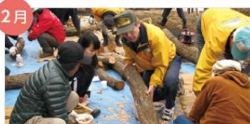
2月 シイタケ植菌交流会 間伐したナラヤクスギを利用してシイタケ栽培。写真左は植菌のための穴あけ作業。収穫は春と秋です。