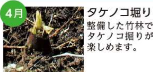
4月 タケノコ堀り 整備した竹林でタケノコ掘りが楽しめます。