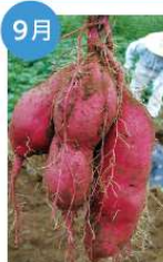
9月 さつまいの収穫