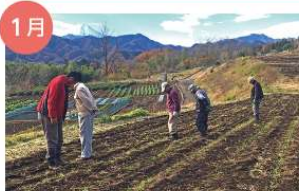
1月 麦踏み 霜柱による根の浮きを押さえ、茎の根付きを良くします。